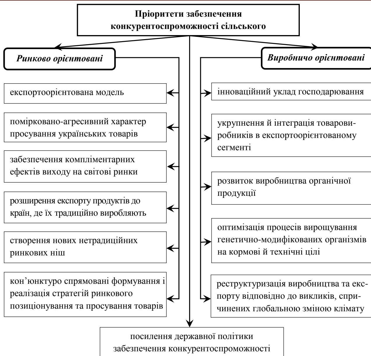
Рис. 3. Основні пріоритети забезпечення конкурентоспроможності сільського господарства України на світових ринках